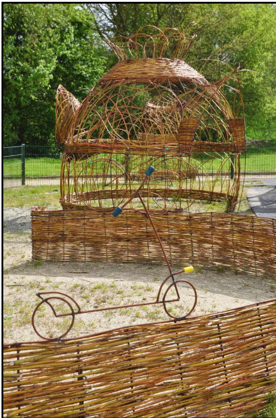
Un nouvel espace mobilité à la Maison de l'Enfance

Mairie de Trémeur ☎ 02 96 84 80 98 mairie@tremeur.fr www.tremeur.fr